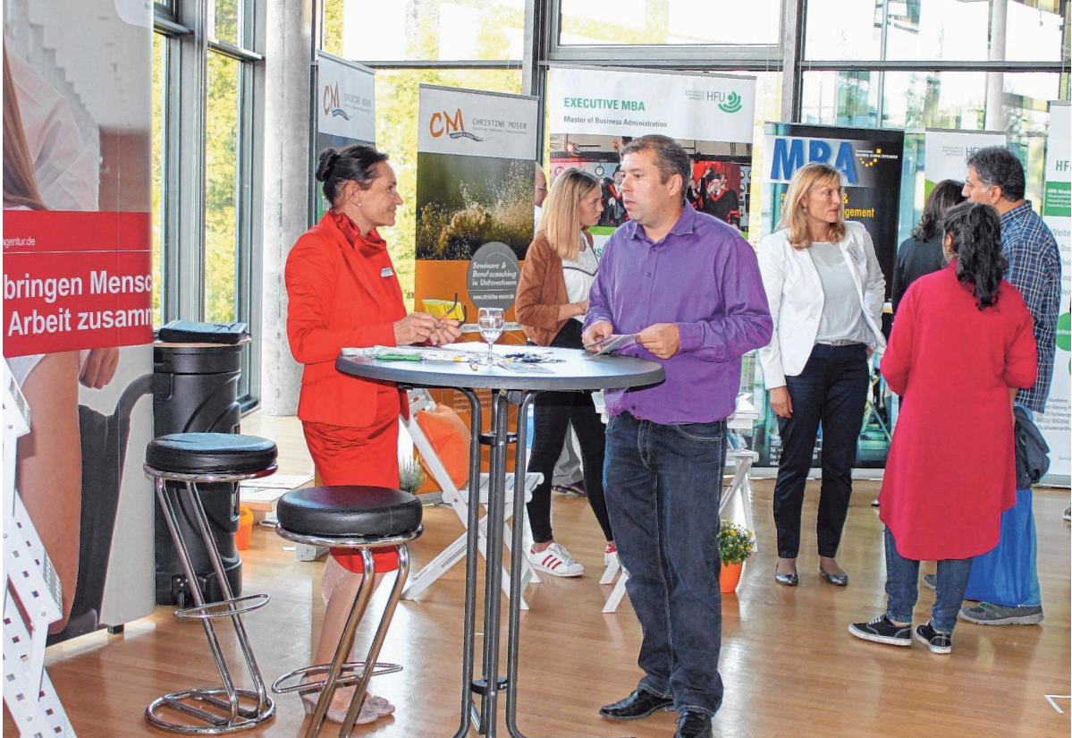
Kaum etwas los ist am Donnerstag bei der Premiere der Informationsmessen „Option2“ und „Wegweiser“ in der Tuttlinger Stadthalle.